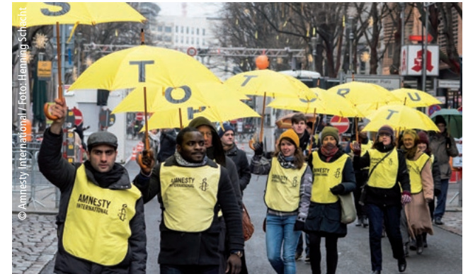
مجموعة منظمة العفو الدولية الناطقة بالإنجليزية في برلين أثناء نشاطها في إطار حملة "وقف التعذيب" لعام 2014

ونفعل كل هذا من خلال التحقيق في انتهاكات حقوق الإنسان وقضخ مرتجيبها، وتحفيز حركتنا العالمية وحشد جهودها، وتوعية الأجيال المقبلة حتى يتحقق حلمنا يوماً ما، بأن تصبح حقوق الإنسان واقعاً معاشاً ينعم به كل البشر على السواء.