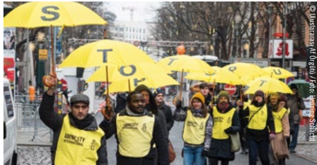
Berlin'in İngilizce konuşulan Af Örgütü grubu, 2014 yılında „İşkenceyi Durdurun“ kampanyası için eylemde.

Tüm bunları insan hakları ihlallerini soruşturarak ve ifşa ederek, küresel olarak harekete geçerek ve gelecek kuşakları eğiterek yapıyor ve böylelikle insan haklarına dair hayallerin bir gün herkes için gerçeğe dönüşmesini istiyoruz.