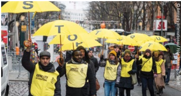
El Grupo de habla inglesa de Amnistía de Berlín en acción durante la campaña contra la tortura en 2014.

Para ello, investigamos y sacamos a la luz los abusos contra los derechos humanos, movilizamos a nuestro movimiento global y educamos a las generaciones futuras, con el fin de que, un día, el sueño de los derechos humanos para todas las personas se haga realidad.