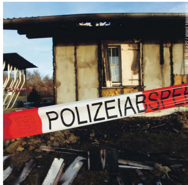
Ein Unbekannter verübte im Januar 2014 einen Brandanschlag auf eine bewohnte Flüchtlingsunterkunft im bayerischen Germering.

Brandanschläge, tätliche Angriffe, Einschüchterungen: Deutschland erlebt derzeit eine drastische Zunahme rassistischer Gewalt. Fast täglich werden Menschen angegriffen, weil sie aus Sicht der Täterinnen und Täter nicht in das Bild eines „weißen Deutschlands“ passen – sei es wegen ihrer äußeren Erscheinung, ihrer angenommenen Religion oder anderer Zuschreibungen. 2015 gab es laut offiziellen Angaben 13.846 „rechts motivierte“ Straftaten. Die Behörden registrierten 1.031 Angriffe auf Flüchtlingsunterkünfte – und damit fünfmal so viele wie 2014. Zivilgesellschaftliche Organisationen gehen sogar von noch wesentlich höheren Zahlen aus. Rassistische Gewalt ist kein neues Phänomen, inzwischen ist sie jedoch erschreckend alltäglich.