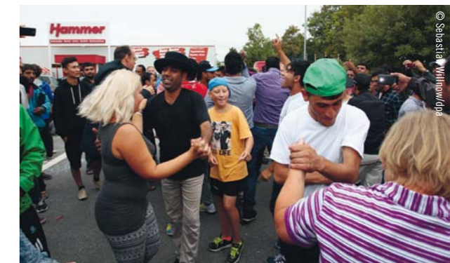
Tanzende Menschen bei einem Willkommensfest für Flüchtlinge im sächsischen Heidenau im August 2015. Wenige Tage zuvor hatte es in dem Ort massive rassistische Ausschreitungen gegeben.