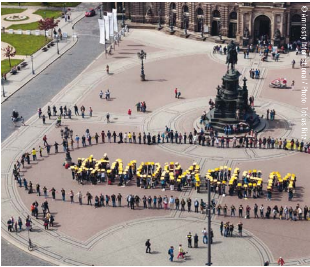
Amnesty-Mitglieder bei einer Aktion gegen Rassismus in Dresden im Mai 2015.