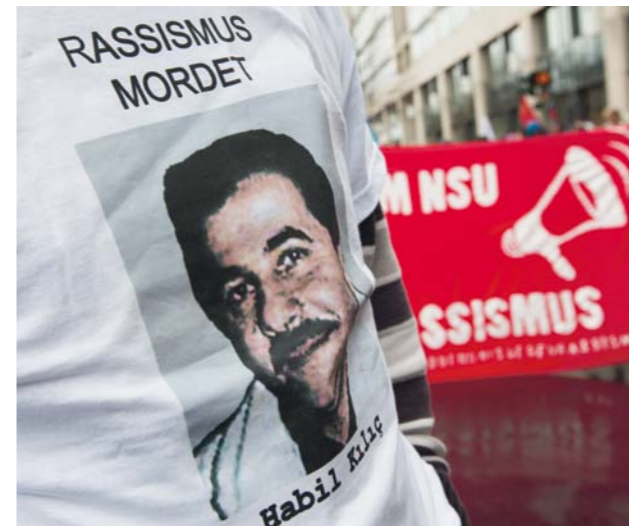
Ein Demonstrant trägt bei einer Protestaktion in Berlin ein T-Shirt mit dem Porträt des ermordeten NSU-Opfers Habil Kılıç (November 2013).