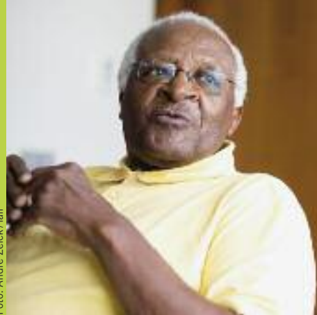
ERZBISCHOF DESMOND TUTU