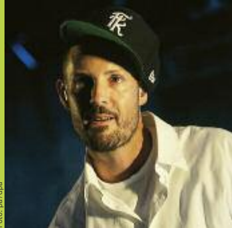
MAX HERRE, SÄNGER