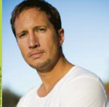
BENNO FÜHRMANN, SCHAUSPIELER

1 DIE ALLGEMEINE ERKLÄRUNG DER MENSCHENRECHTE WURDE AN EINEM 10. DEZEMBER VERABSCHIEDET. ABER IN WELCHEM JAHR?